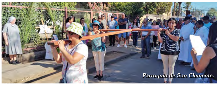
Parroquia de San Clemente.