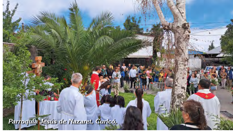
Parroquia Jesús de Nazaret, Curicó.