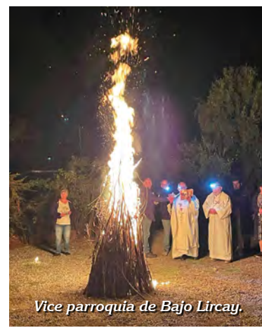
Vice parroquia de Bajo Lircau.