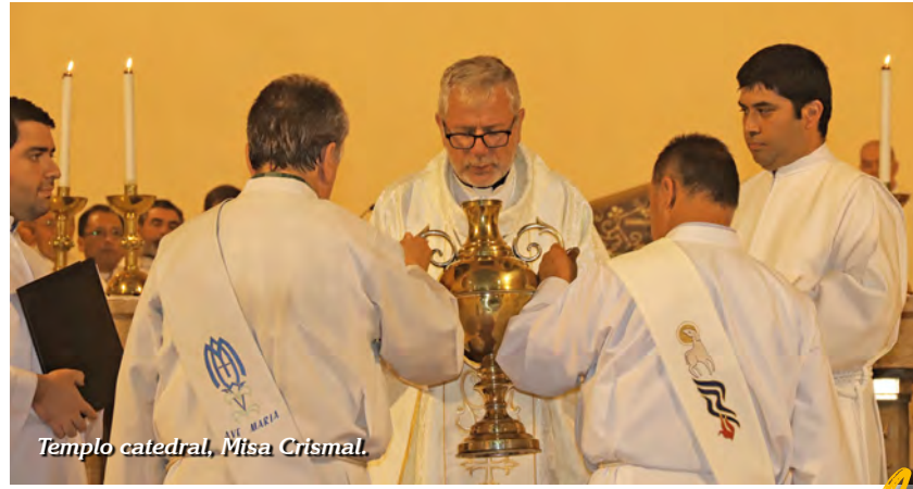
Templo catedral, Misa Crismal.