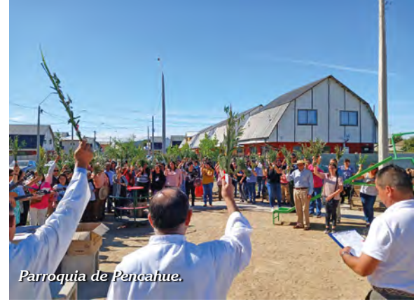
Parroquia de Péncahue.