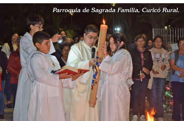
Parroquia de Sagrada Familia, Curicó Rural.