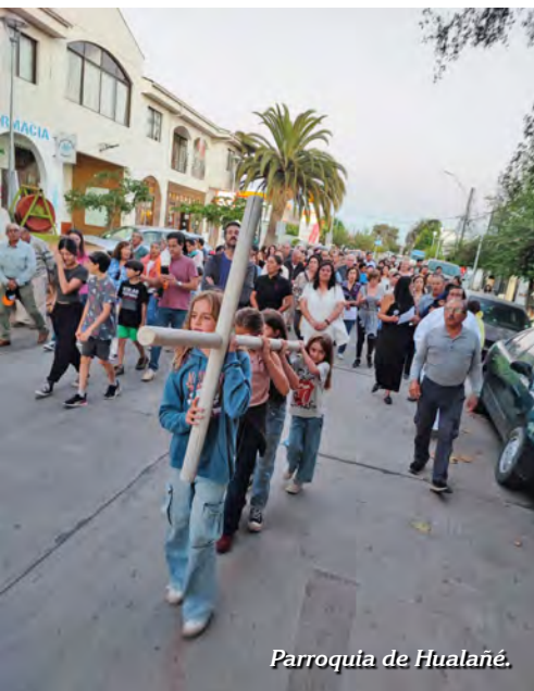
Parroquia de Hualañé.