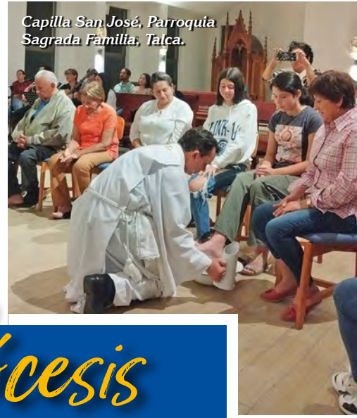
Capilla San José, Parroquia Sagrada Familia, Talca.