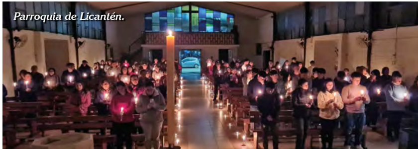
Parroquia de Licantén.