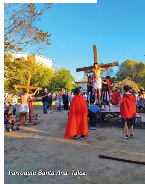
Parroquia Santa Ana, Talca.