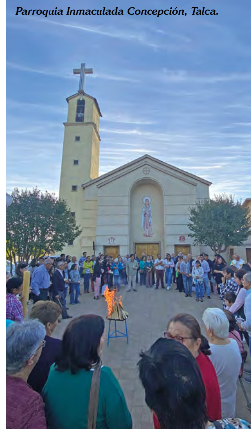
Parroquia Inmaculada Concepción, Talca.