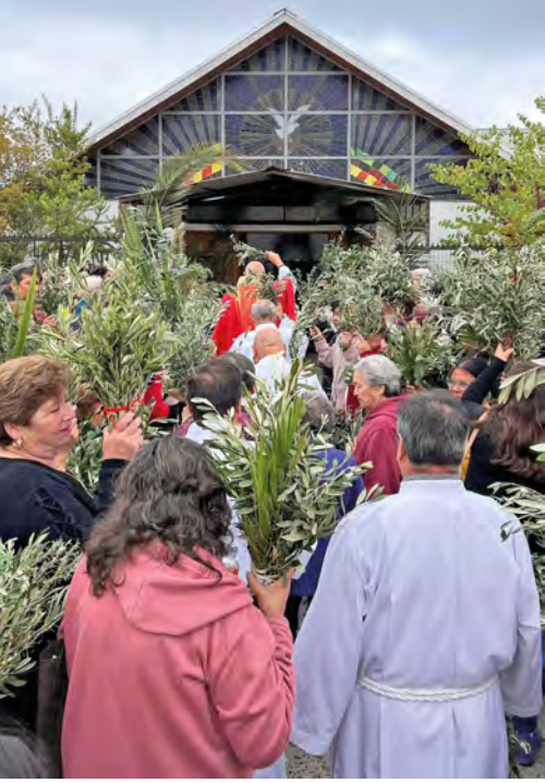
Parroquia Espíritu Santo, Talca