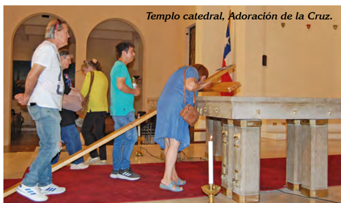
Templo catedral, Adoración de la Cruz.