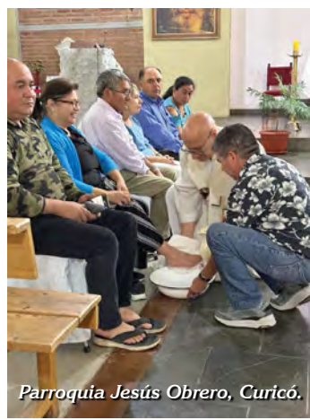
Parroquia Jesús Obrero, Curicó.