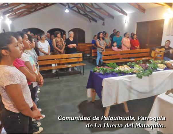
Comunidad de Palquibudis, Parroquia de La Huerta del Mataquito.

No teman. Ustedes buscan a Jesús de Nazaret, el Crucificado. Ha resucitado, no está aquí... (Mc 16, 6)